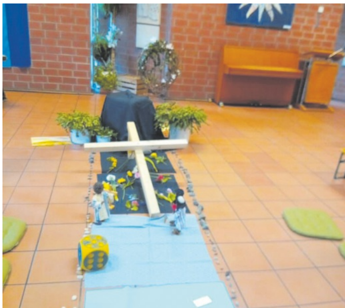
Kinderkreuzweg in Durbach

In Durbach lud die Kinderkirche alle Kinder zum Kreuzweg ein. Jedes Kind durfte eine Blume mitbringen und sie ans Kreuz legen. Im Anschluss banden die Kinder aus Rebzweigen ein Kreuz.