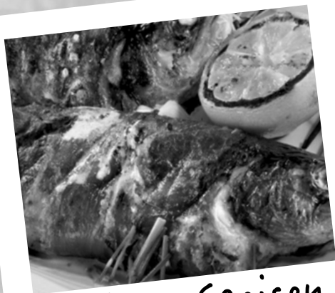
leckere Speisen u.a. Brunos Bachforellen