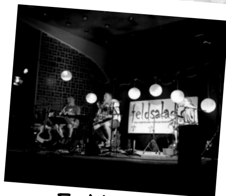
Feldsalad Live Musik